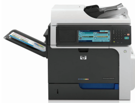
MFP HP Color LaserJet Enterprise CM4540