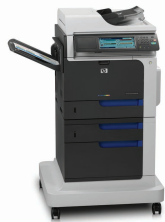
HP Color LaserJet Enterprise CM4540f MFP