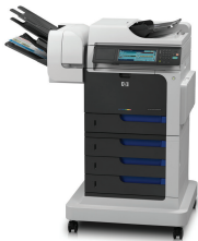
HP Color LaserJet Enterprise CM4540fsm MFP